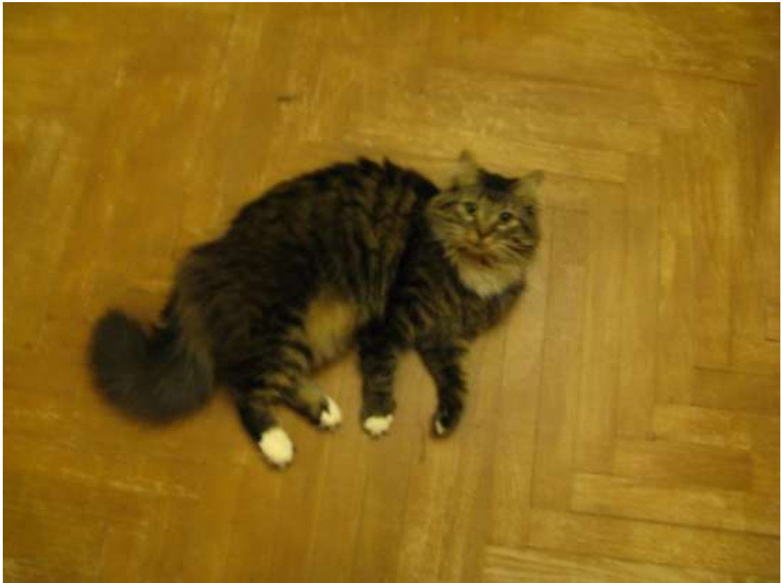
Фото 10. Кузя – 2 года спустя