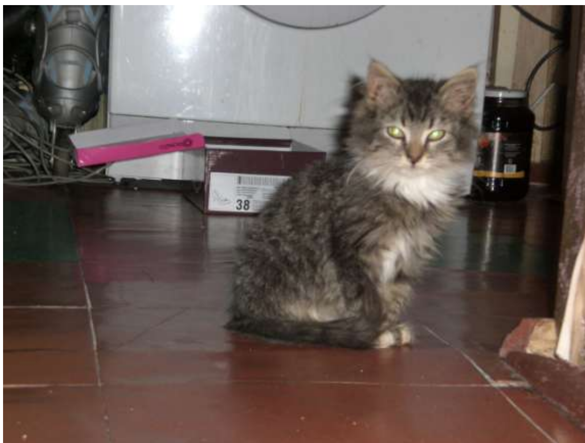
Фото 2. Кузя

Так в нашем доме появился совершенно дикий котенок, которого мы назвали Кузей. Он был больной: непрерывно чихал и кашлял, глазки гноились. От нас он прятался под диваном или за мебелью, выходил из своего укрытия только по ночам, когда мы спали, его присутствие выдавали только съеденный к утру корм и содержимое лоточка. Сейчас он уже привык к нам и даже позволяет брать себя на руки, иногда. Но когда к нам приходят гости, он всегда прячется.