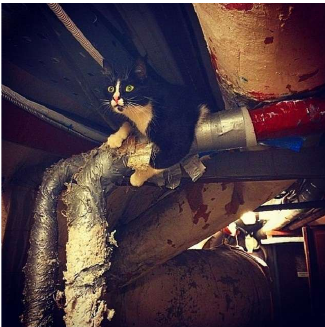
Фото 5. Эрмитажный кот

В нашей стране кошки тоже служат в музеях. Так, широко известно такое понятие, как Эрмитажный кот. Четвероногие хранители стали одним из брендов Петербурга. В Эрмитаже трудится около 50 кошек. Это очень старая традиция и возникла она во времена правления императрицы Елизаветы Петровны, которая очень боялась мышей. Указом от 26 октября 1745 года она повелела о высылке ко дворцу 30 самых лучших и годных к ловле мышей котов. Правда в то время дворец императрицы находился не на Дворцовой набережной, а на углу Невского проспекта и Малой Морской улицы. Но традиция с тех пор сохранилась, и если раньше кошкам позволялось находиться и в царских покоях, то сейчас они в залы не допускаются. В основном кошки проживают в подвалах, которых в Эрмитаже 18 километров,