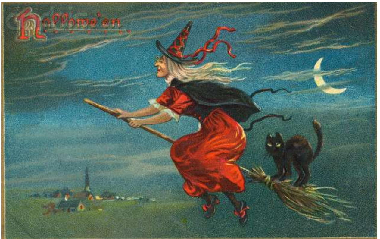
Фото 4. Кошка - помощница ведьмы

В средневековой Британии и Европе кошки долгое время считались прислужниками сатаны и подвергались жесточайшим гонениям. Это связано с тем, что римско-католическая религия отождествляла их с языческими (дохристианскими) культурами. Множество невинных созданий в Средние века гибли на кострах вместе со своими хозяйками, которых считали ведьмами. Особенно не везло черным кошкам. А уж если черный кот перебежал дорогу, его могли повесить или утопить.