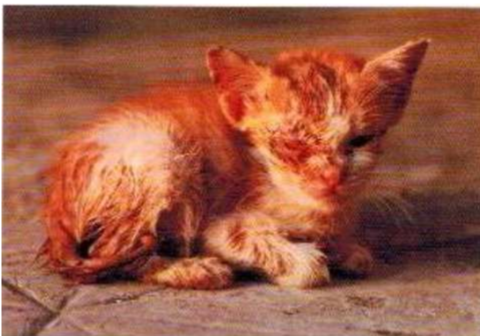
Фото 1. Бездомный котенок

Голодные, бездомные, ободранные – они представляют собой горестное зрелище!