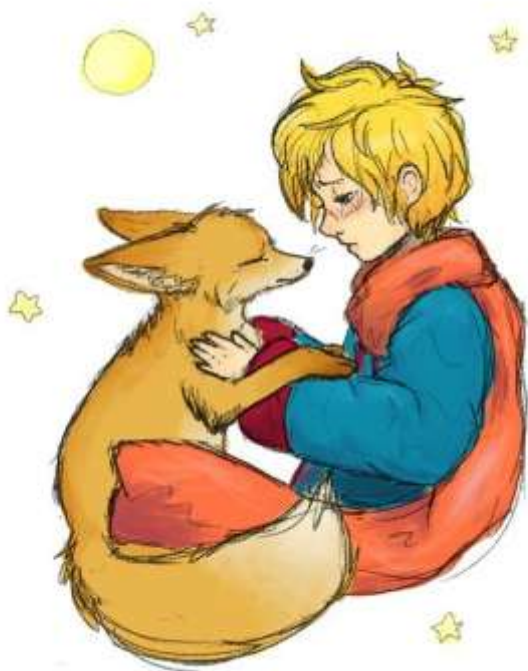
Фото 12. Маленький принц