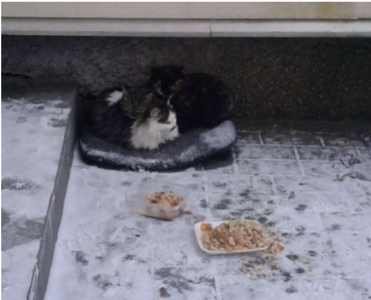
Фото 8. Бездомные котята согреваются друг друга морозной зимой (пос. Молодежное, янв. 2015)

Тогда почему же на улицах города и в дачных поселках столько брошенных животных?