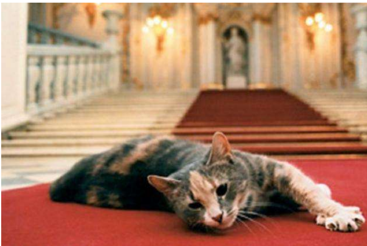
Фото 6. Эрмитажный кот

некоторые живут в служебных помещениях на верхних этажах. Однако, никакого содержания от государства Эрмитажные коты, в отличие от Британских, не получают. Они содержатся исключительно за счет частных пожертвований и спонсорской помощи от производителей кормов и ветеринарных клиник. Благодаря этому на каждого кота заведена ветеринарная карточка и паспорт. Все они проходят ежегодный ветеринарный осмотр и получают прививки и необходимое лечение.