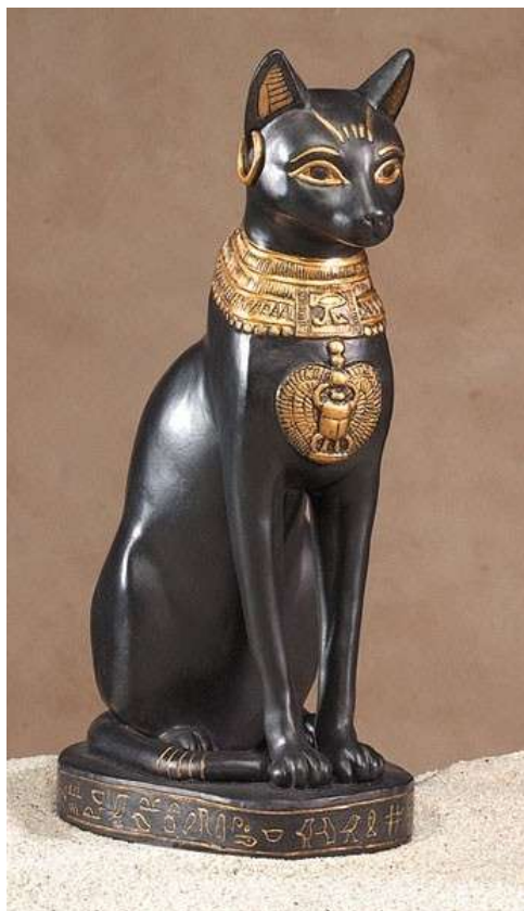
Фото 3. Баст

Из-за обожествления кошек жители Древнего Египта терпели даже военные поражения. В 525 году до н.э. в сражении при Пелусии войско персидского царя Камбиза пошло в атаку на египтян, держа кошек перед собой в виде живого щита. Египтяне не смогли обстреливать их из луков и потерпели поражение.