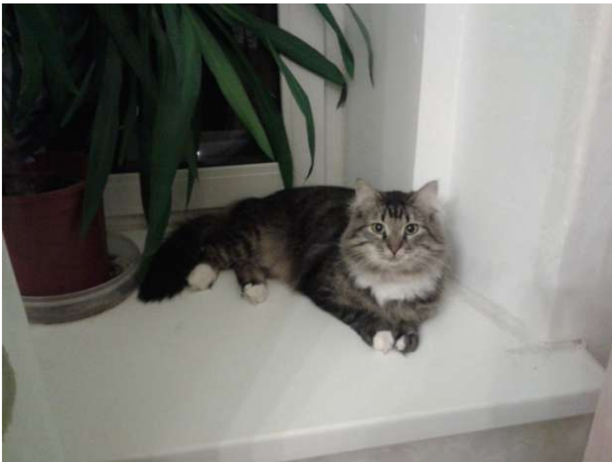
Фото 9. Кузя – год спустя

Если вы задумаете взять в дом кошку, то необязательно покупать породистую. Поверьте, что и беспородная кошка принесет вам не меньше радости в общении, чем дорогая породистая. И при этом еще одним бездомным животным станет меньше на улице.